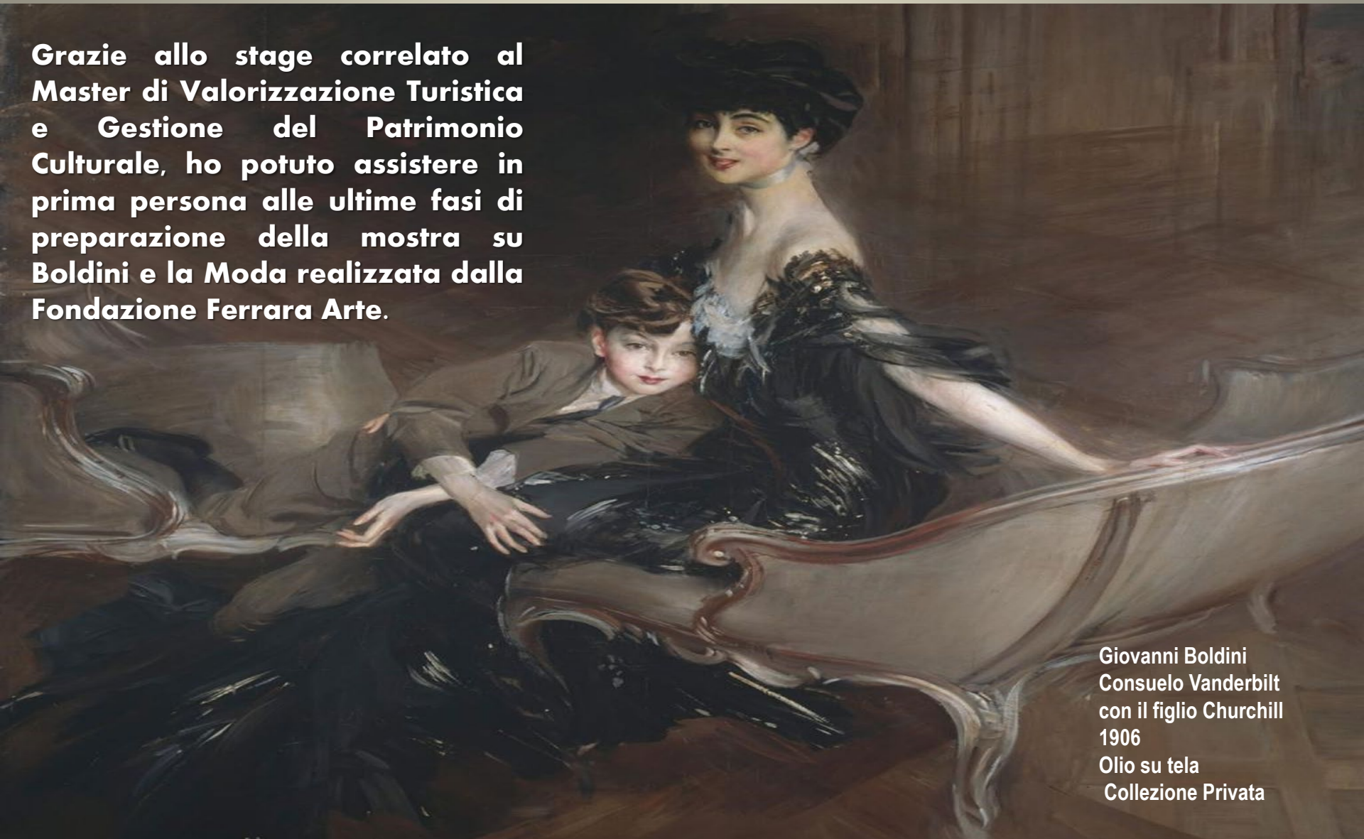
Giovanni Boldini Consuelo Vanderbilt con il figlio Churchill 1906 Olio su tela Collezione Privata

Grazie allo stage correlato al Master di Valorizzazione Turistica e Gestione del Patrimonio Culturale, ho potuto assistere in prima persona alle ultime fasi di preparazione della mostra su Boldini e la Moda realizzata dalla Fondazione Ferrara Arte.