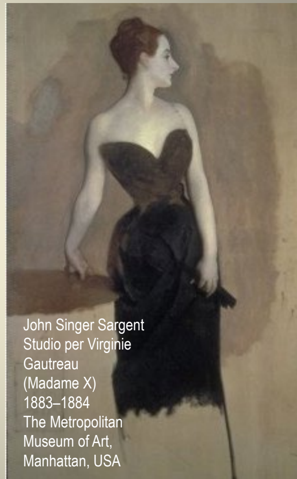
John Singer Sargent Studio per Virginie Gautreau (Madame X) 1883-1884 The Metropolitan Museum of Art, Manhattan, USA

La moda ha influenzato altri pittori, come Degas, Sargent, Whistler, alcune opere dei quali erano presenti a Palazzo dei Diamanti.